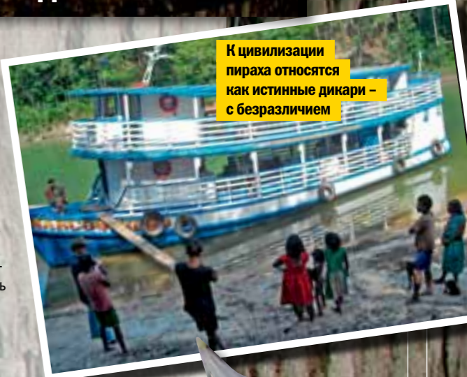
К цивилизации пираха относятся как истинные дикари – с безразличием

Тридцать лет обучения пираха основам христианства не прошли для Дэниела Эверетта даром: сегодня он убежденный атеист. Живя среди этих маленьких (средний вес мужчины пираха – 40 кг, рост – 150 см), полуголодных, никогда не спящих, никуда не спешащих, постоянно смеющихся и не знающих ни греха, ни веры людей, он пришел к выводу, что человек куда более сложное существо, чем рассказывает Библия, а религия не делает нас ни лучше, ни счастливее. «Пираха – самый счастливый народ на Земле, – пишет он. – Лишь спустя многие годы я понял, что это мне нужно учиться у них, а не наоборот».