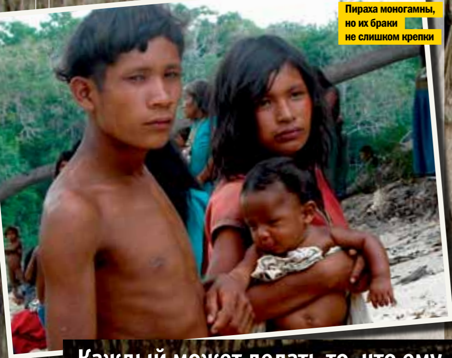
Пираха моногамны, но их браки не слишком крепки

Каждый может делать то, что ему хочется. Ни стыда, ни вины они не знают и не понимают, что это такое