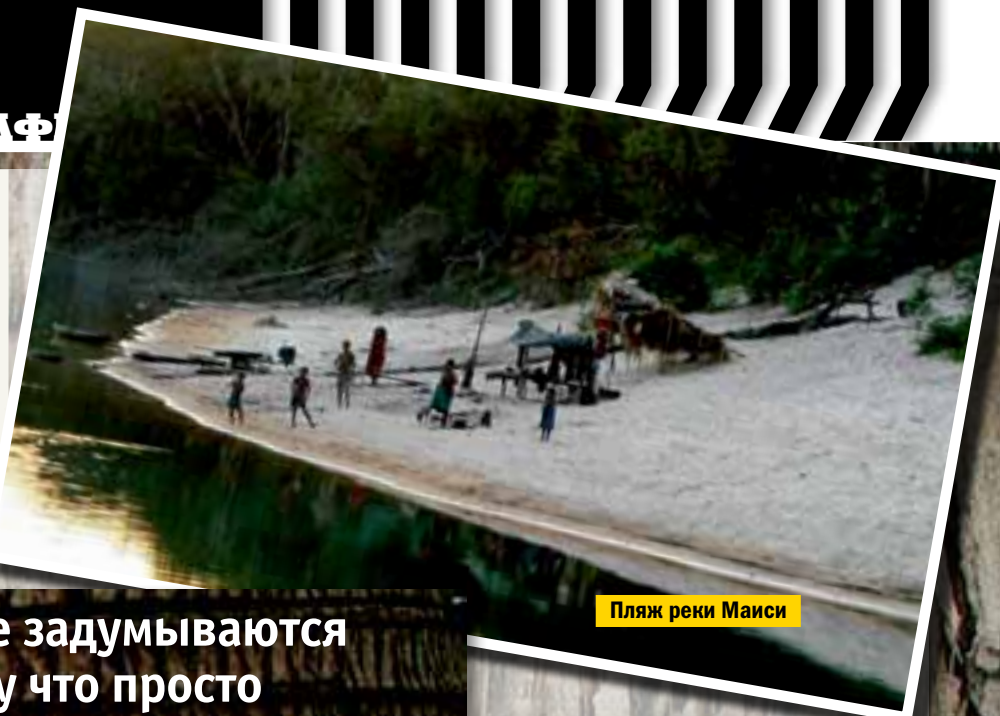
Пляж реки Маиси