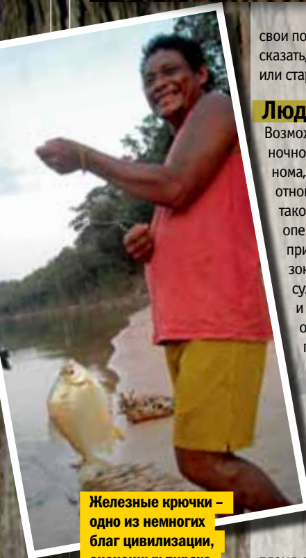
Железные крючки – одно из немногих благ цивилизации, оцененных пираха

е фактически заканчивалось. Ни один миссионер так и не сумел выучить язык пираха, и ни один пираха не научился разбирать серии странных звуков, вылетающих из верхнего отверстия этих милых белых людей. Поэтому Евангелическая церковь США, подбирая кандидата на катехизацию бедных дикарей, сделала умную вещь: туда послали молодого, но талантливого лингвиста. Эверетт был готов к тому, что местный язык окажется трудным. Но он ошибался, в чем честно признался тридцать лет спустя: «Этот язык не был сложен, он был уникален. Ничего похожего на Земле боль-