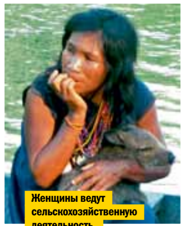
Женщины ведут сельскохозяйственную деятельность, но без фанатизма