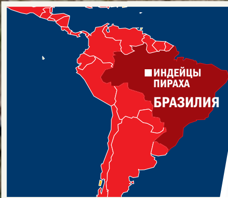
■ ИНДЕЙЦЫ ПИРАХА БРАЗИЛИЯ